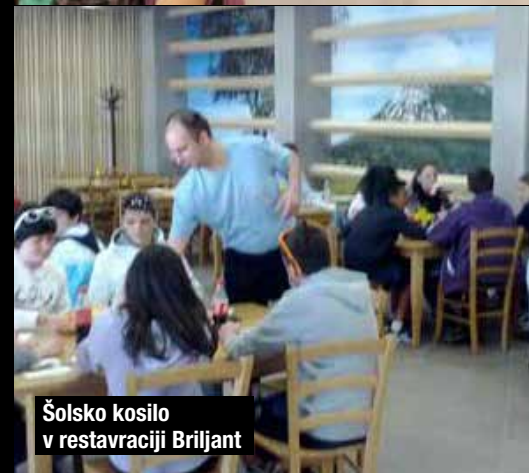
Šolsko kosilo v restavraciji Brilljant