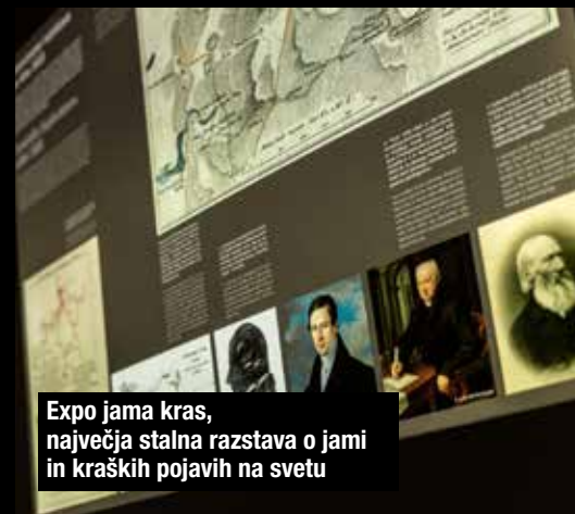
Expo jama kras, največja stalna razstava o jami in kraških pojavih na svetu