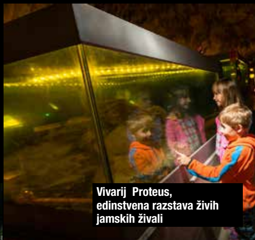
Vivarij Proteus, edinstvena razstava živih jamskih živali