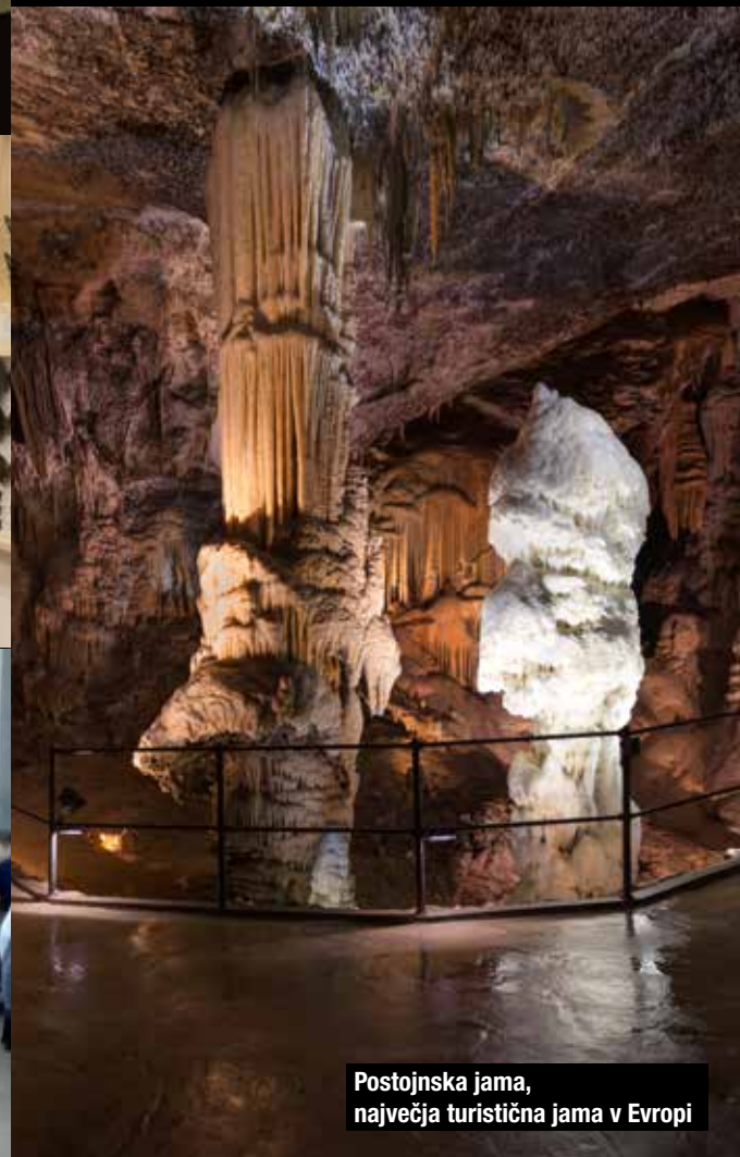
Postojnska jama, največja turistična jama v Evropi