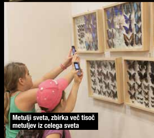
Metulji sveta, zbirka več tisoč metuljev iz celega sveta