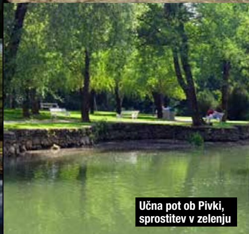
Učna pot ob Pivki, sprostitvev v zelenju