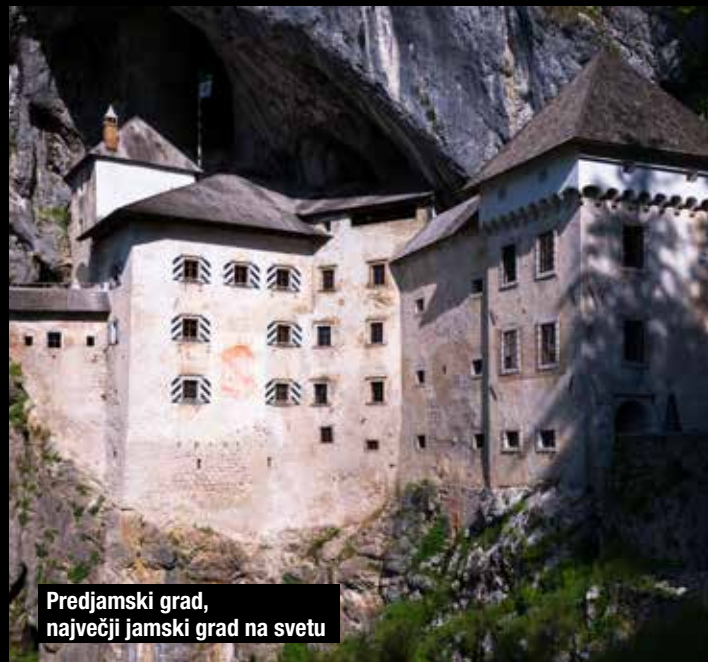
Predjamski grad, največji jamski grad na svetu

Nepozabno doživetje in bogata izobraževalna vsebina.