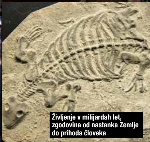
Življenje v milijardah let, zgodovina od nastanka Zemlje do prihoda človeka