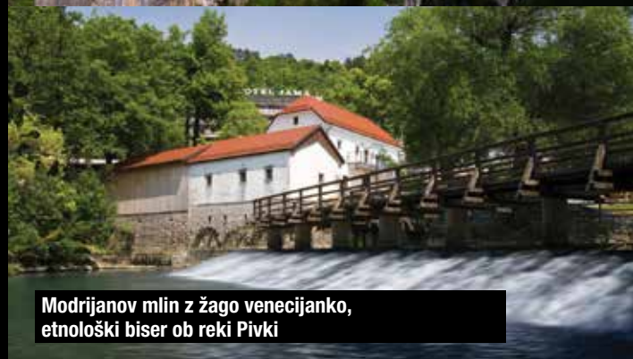
Modrijanov mlin z žago venecijanko, etnološki biser ob reki Pivki